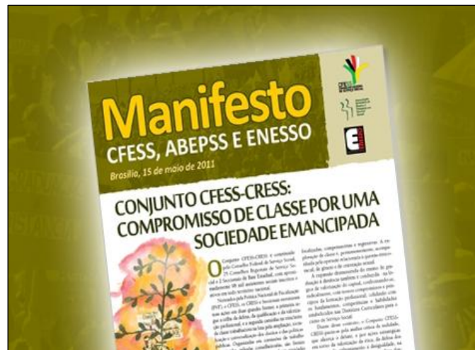
(Manifesto CFESS, ABEPSS e ENESSO. Em: maio de 2011.)

No dia 15 de maio de 2011, dia do assistente social, as entidades representativas da categoria – CFESS-CRESS, ABEPSS e ENESSO – lançaram um manifesto em conjunto, reverenciando o serviço social pela sua dimensão política de compromisso de classe com uma sociedade emancipada. Considerando o debate da emancipação na contemporaneidade, sobre as respostas às expressões da “questão social”, analise as afirmativas a seguir.